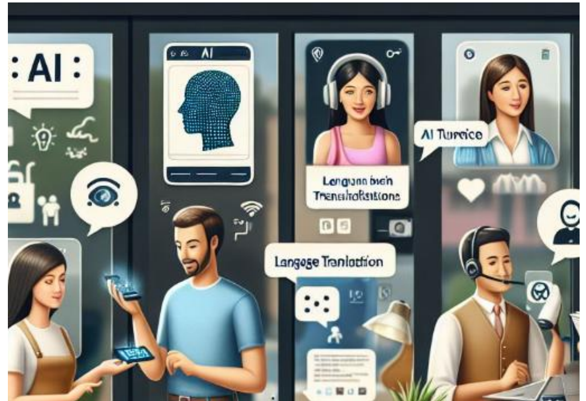
Kuva luotu tekoälyllä (Copilot)