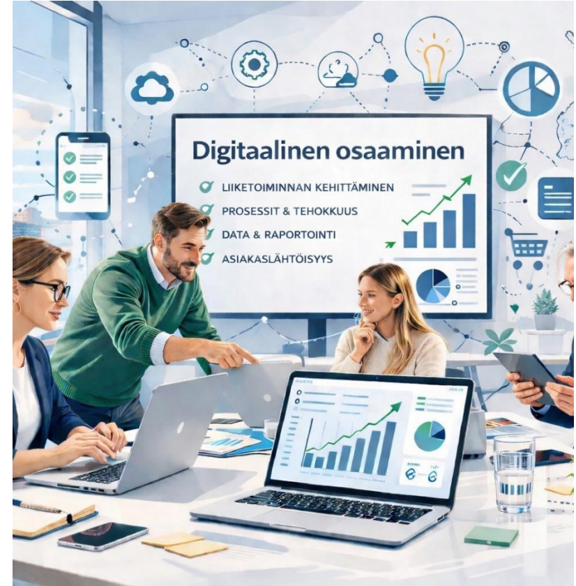
Kuvituskuva tehty tekoälyllä