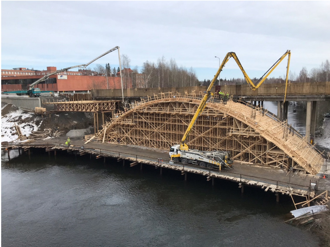
Kuva 3. Kaaren valu 27.2.2019