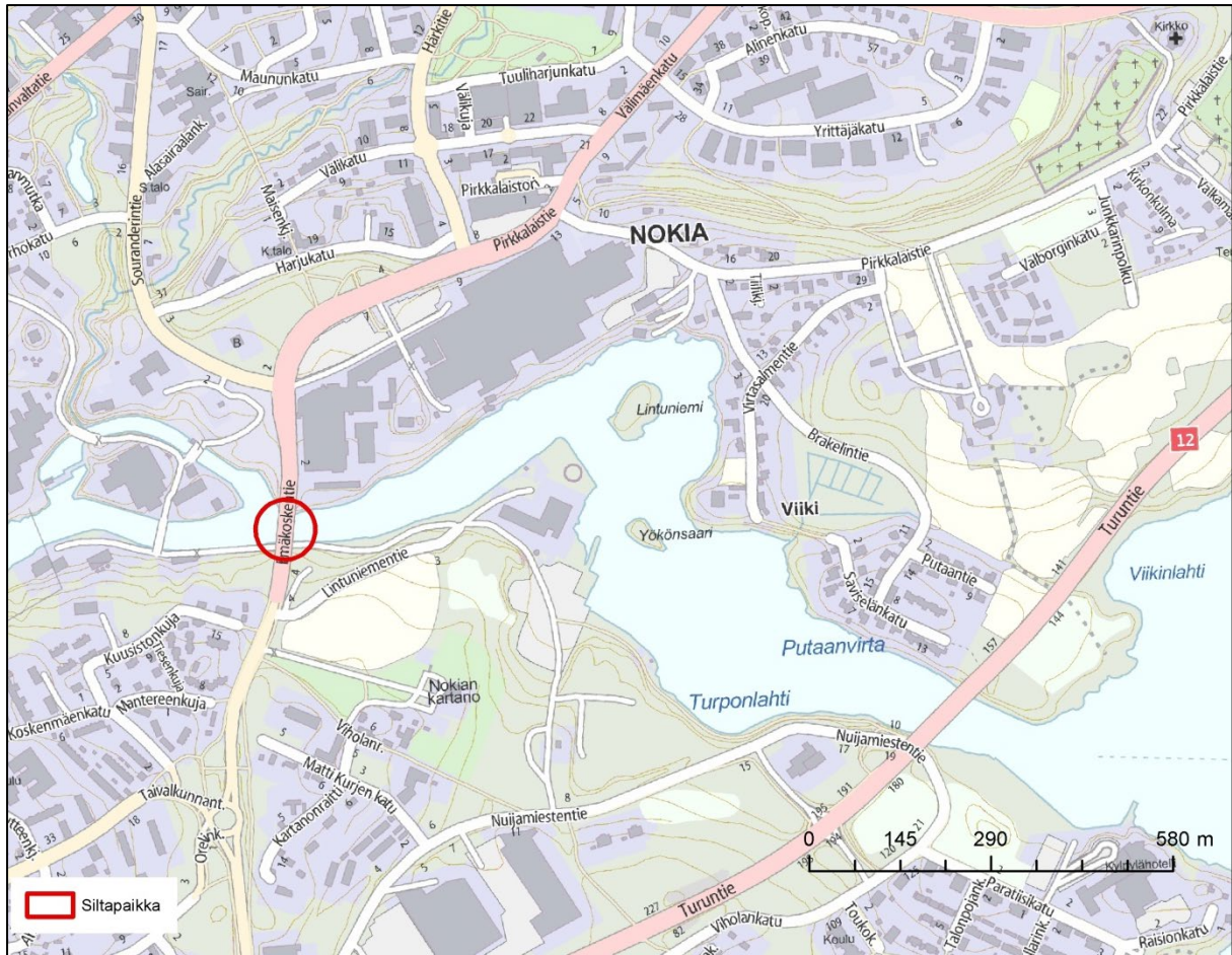
Kuva 1. Suunnittelukohteen sijainti on merkitty karttaan punaisella ympyrällä.