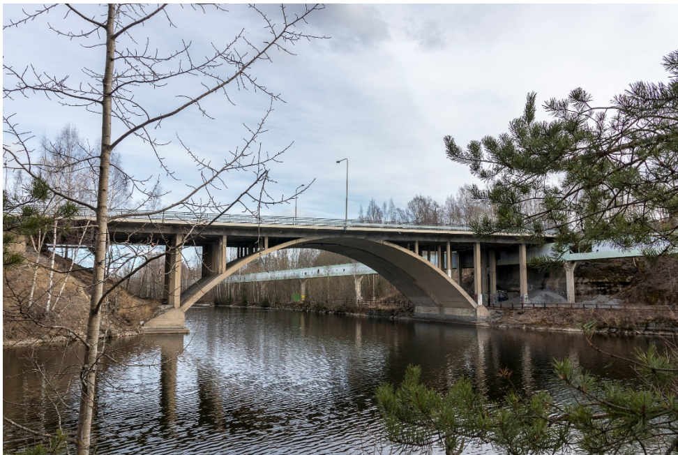
Kuva 2. Nykyinen Emäkosken silta kuvattuna Tehdassaaresta keväällä 2017